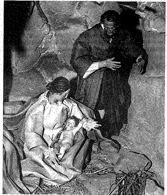
Belen napolitano en el Museo de Bellas Artes

La Asociación belenista también es responsable, junto con la Caja Vital, de la segunda muestra de nacimientos organizada en la Casa